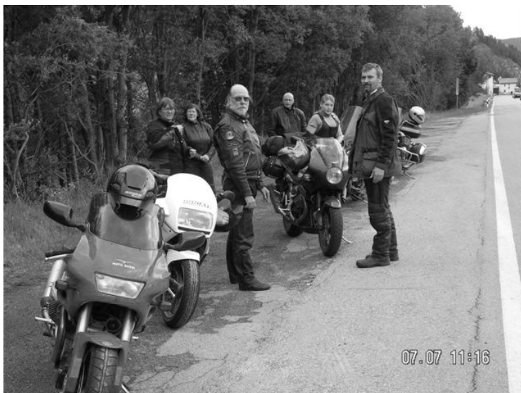
MOTO GUZZI GIORNALE